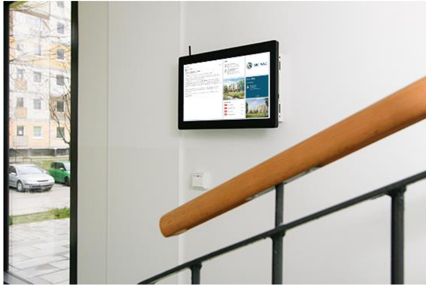
Ein Bildschirm ersetzt das klassische schwarze Brett im Treppenaufgang, die Informationen kommen aus der Cloud.

zum bestmöglichen Produkt für unsere gemeinsamen Kunden“, sagt Klaus Schäfer, Vorstand der gekartel AG.